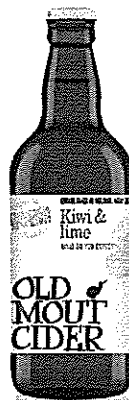
Old Mout Kiwi&Lime 500 ml