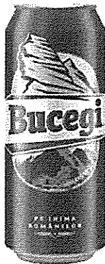
Can 0.5 L