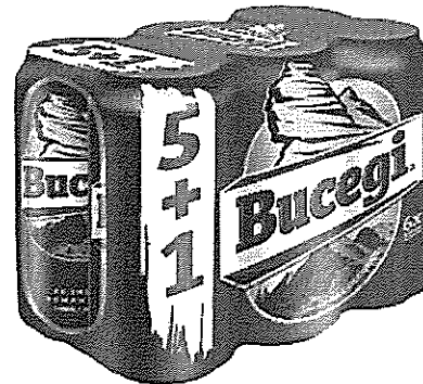
6X Can 0.5 L