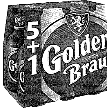
6x Sticla 0.33 L