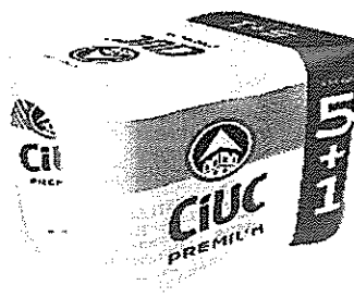
(5+1) Dz. 0,5L