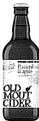
Old Mout Passionfruit 500 ml