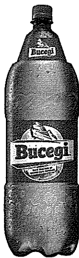
Pet 2.25 L