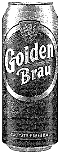
Can 0.5 L