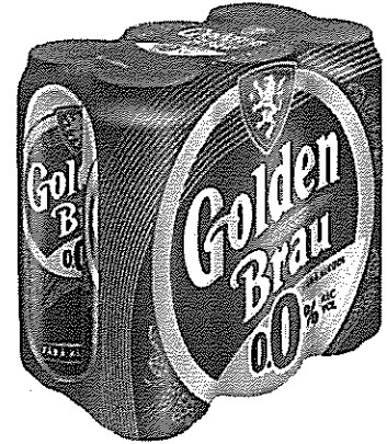
6x Can 0.5L 0.0%