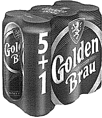
6x Can 0.5 L