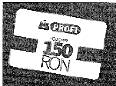
Voucher de cumparaturi Profi