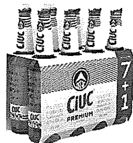
(7+1) St. 0,33L