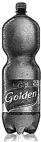
Pet 2,5 L