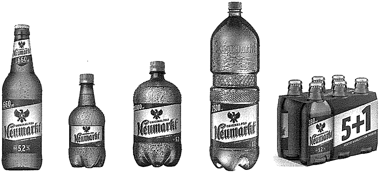
Sticla 0.66 L Pet 0.5 L Pet 1 L Pet 2.5 L 6x Sticla 0.33 L