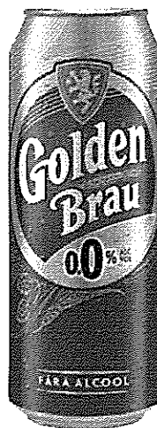
Can 0.5 L 0.0%